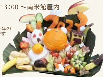
※写真は昨年のおせちです