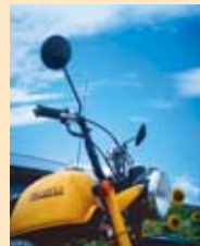
「夏空」鶴見正孝様 作品