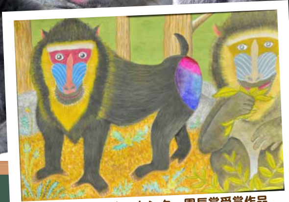
2023 年日本モンキーセンター園長賞受賞作品